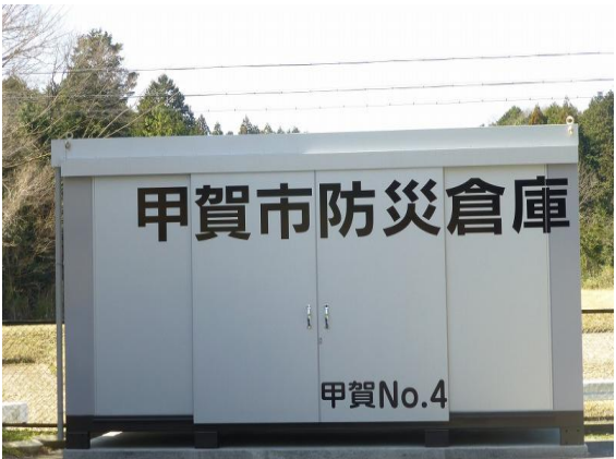
市内に整備されている防災倉庫