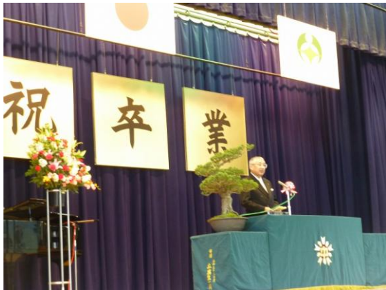
甲賀中学校卒業式