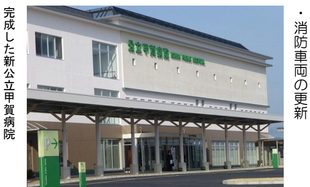
完成した新公立甲賀病院