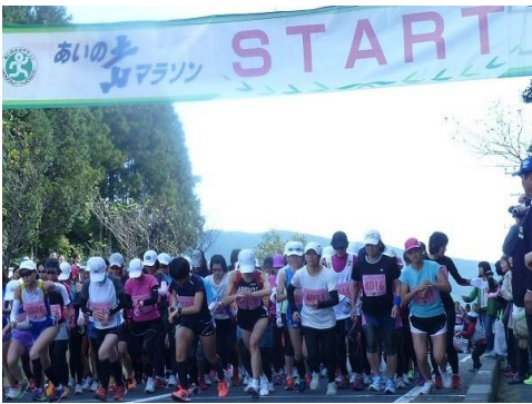
あいのいちマラソンのスタート

今年の秋も各地で様々な行事やイベントが行われました。文化の日の11月3日には甲賀学園「鹿深の家」の50周年記念式典が盛大に行われました。鹿深の家は昭和37年に旧佐山中学校校舎を利用して開設され、このたび50周年を迎えられました。現在は約50人の子どもたちが生活しており、元気に学校や保育園に通っています。