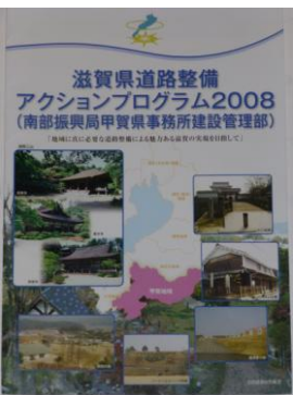
県道路整備アクションプログラム

先日行われた鹿深の家の50周年記念式典では子どもたちが和太鼓の演奏を発表しました。約2ヶ月間、毎日のように練習して、本番は素晴らしい演奏を披露してくれました。一生懸命になること、みんなで力を合わせることを素晴らしさをあらためて教えられた発表でした。