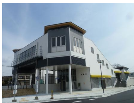
寺庄駅周辺整備事業（寺庄駅舎）