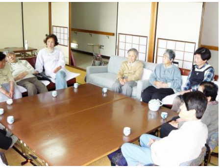
要支援の方々対象のサロン（佐山荘で）

健康福祉部長 市内の65歳以上の方を対象に介護保険適用施設及び障害者施設でのボランティアに対し実施するもので、現在受付を行っている。多くの高齢者の参加を期待している。