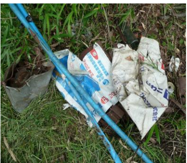
後を絶たない不法投棄

美しい甲賀市の自然を守るため、行政と市民が協力し不法投棄をなくしていかねればなりません。