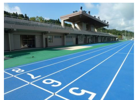
水口スポーツの森陸上競技場