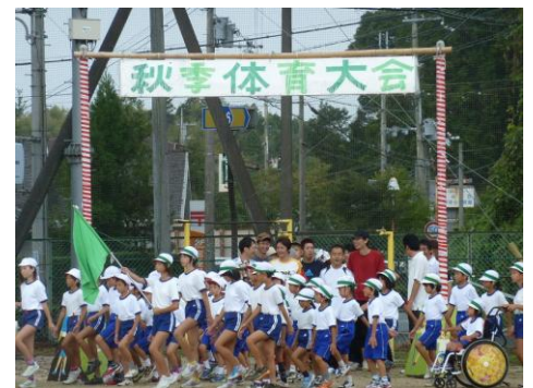
秋晴れの中での運動会（佐山小）

9月定例議会が8月30日から9月27日までの29日間開催されました。9月議会では平成22年度決算など45件の議案について審議しました。平成22年度一般会計決算は景気低迷による厳しい社会状況の中ではありましたが、様々な取り組みの結果、歳入歳出とも2年連続で前年を上回りました。市財政も改善の方向で、実質公債比率も16.8%となり起債許可団体となる18%を下回るなど、最悪期を脱することができました。しかしながら、まだまだ厳しい経済状況の中、引き続き限られた財源の有効活用と財政健全化に向けた取り組みが重要です。