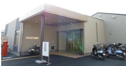
水口医療センター

平成23年度一般会計補正予算では約4億9千万円が追加されました。主な内容はコニユニティー推進基金積立金や台風6号に伴う災害復旧事業、水口北部地域防災コミュニティセンターの測量設計業務委託、佐山荘トイレバリアフリー化工事などです。条例案件では水口医療介護センター条例他5件が可決されました。人事案件は公平委員会委員と人権擁護委員の推薦でいずれも同意となりました。市道の認定は水口町新城地先の市道路線の認定、契約締結は地域情報化基盤整備事業光ファイバー網敷設工事（水口・信楽・土山の一部）の契約です。請願では「県立信楽高等学校の分校化反対を求める請願」が採択され、それに伴い「県立信楽高等学校の分校化反対を求める意見書」が可決されました。